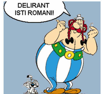
„Delirant isti Romani!“ = „Die spinnen, die Römer!“

Jgst. 7-11: Erwerb des Latinums am Ende der Jgst. 11/EF